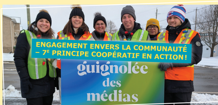
ENGAGEMENT ENVERS LA COMMUNAUTÉ - 7 E PRINCIPE COOPÉRATIF EN ACTION!

L'atelier comprenait plusieurs activités pratiques : introduction au jardinage écologique, plantation d'un mini jardin de fines herbes, échanges et questions-réponses, et une visite guidée du jardin. Les membres ont eu droit à une succulente dégustation de thé, de fraises, de bagel et de miel, ajoutant une touche de convivialité à cette journée d'apprentissage.