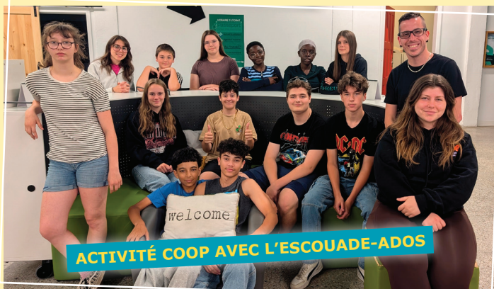
ACTIVITÉ COOP AVEC L'ESCOUADE-ADOS

La Fédération des coopératives d'habitation de la Mauricie et du Centre-du-Québec est heureuse de s'associer en tant que partenaire à l'Escouade-Ados - CIEC de Drummondville du Carrefour jeunesse-emploi Drummond. Tout comme l'an dernier, la Fédération a organisé une activité originale pour sensibiliser les jeunes au mouvement coopératif en habitation.