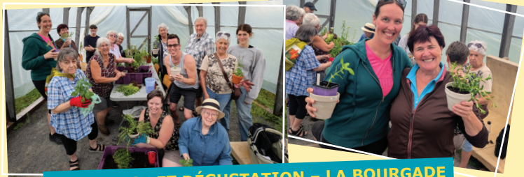
JARDINAGE ET DÉGUSTATION - LA BOURGADE COOP DE SOLIDARITÉ

Parce qu'éduquer et former la relève la coopérative est au cœur de notre mouvement et de notre Fédération!